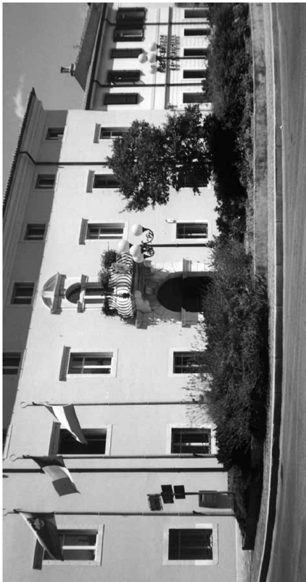
Palazzo Comunale di Farra d'Isonzo